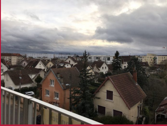
Vue du balcon